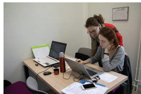
Nos étudiants travaillent en mode projet dans des espaces rénovés.