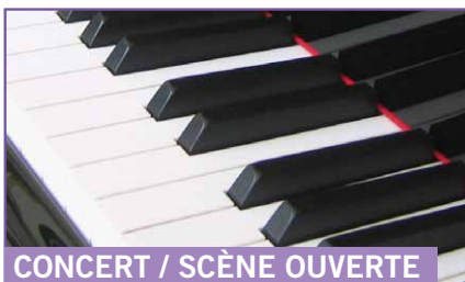
CONCERT / SCÈNE OUVERTE

Des dessins de Nathalie Novi réalisés à partir de textes d'étudiants de l'ESPÉ de Lorraine seront également présentés lors de cette journée Arts&Culture.