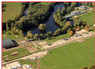
Vue aérienne du Parc archéologique européen de Bliesbruck-Reinheim