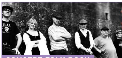
CONCERT FOLK ROCK