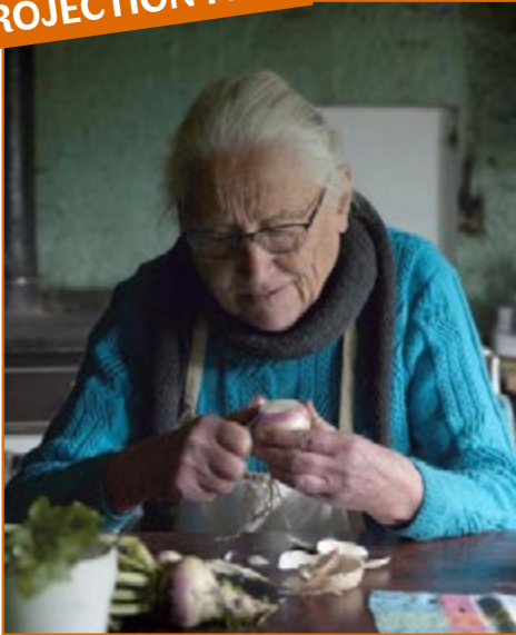
© Les Films de la Pluie et Ana Films