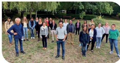
De gauche à droite et de haut en bas : promotion CAPPEI 20-21, M2 ESF 1 er degré/site de Metz-Montigny, M1 1 er degré/site d'Épinal, promotion Psy-EN 20-21