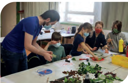
Un atelier convivial