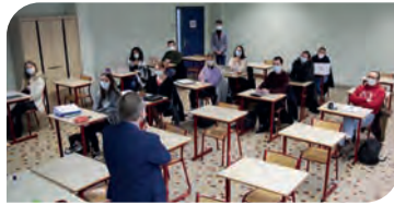
Étudiants en master MEEF et professeurs heureux de se retrouver.