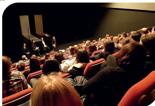
L'EBMK (UL) à Metz