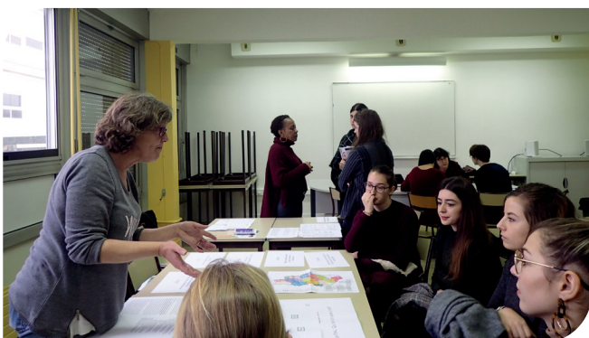
Pôle Inclusion Scolaire, Services ASH de la DSDEN de Meuse

Les partenaires ont également été heureux de pouvoir échanger entre eux et avec l'ensemble des étudiants grâce aux répartitions prévues par les organisateurs. Ces derniers remercient les partenaires ainsi que la direction pour le pot d'accueil, le repas, l'appui à l'organisation matérielle, garants d'une journée conviviale et enrichissante pour tous.