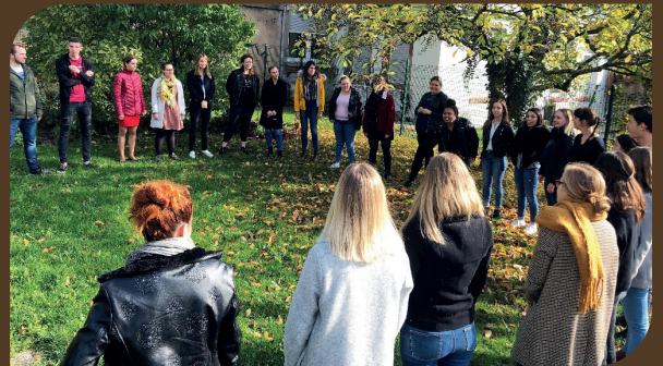
Les étudiants français et allemands font connaissance.