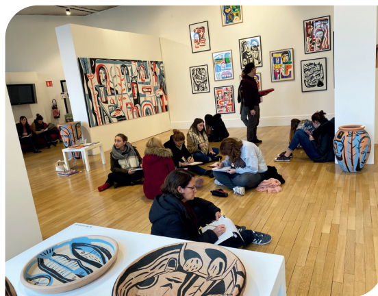
Un cours d'arts visuels en immersion au coeur de l'exposition "Assemblages" de Laurent Corvaisier, décembre 2019

** « Je suis un humain qui peint » de Laurent Corvaisier et Alain Serre ; Edition Rue du Monde, 2010.