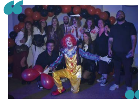
La soirée Halloween en octobre

L'association étudiante In Situ de notre campus de Nancy-Maxéville a son nouveau bureau depuis septembre dernier et propose comme chaque année de nombreuses activités : la cafétéria ouverte à tous dans le bâtiment E de Maxéville, objets promotionnels bientôt proposés à la vente (mugs, sacs et sweats) et soirées. Vous pouvez suivre son actualité sur Facebook ( asso.insitu.inspe54 ) ou sur Instagram ( insitu_nancy_maxeville ).