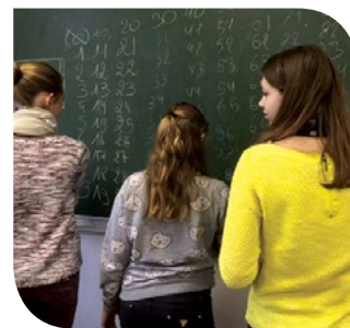
Les élèves dans la peau de chercheurs en mathématiques