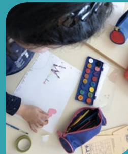
Séance Abécéd'aire hors les murs. Ecole Paul Bert Pagny

En mars et avril dernier, la BU du site de Maxéville a présenté dans ses locaux le projet « Abécéd'Air ».