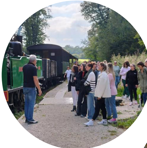
Journée des personnels BIATSS