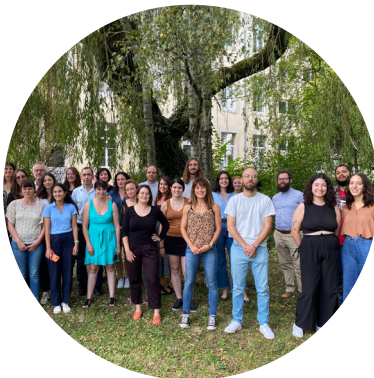
1 ère journée de formation pour les Psychologues de l'Éducation nationale