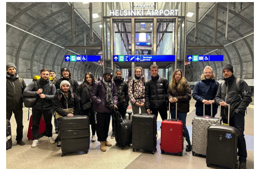
Voyage en Finlande d'étudiants en master MEEF (2024)