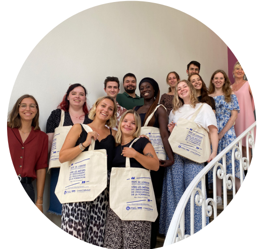
Journée d'intégration des étudiants futurs CPE