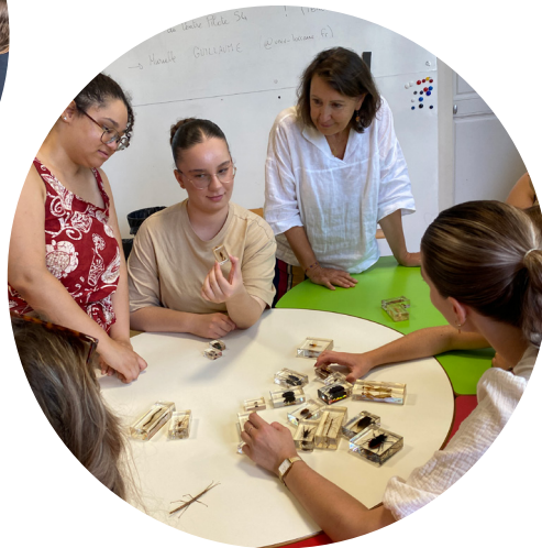
Journée d'intégration des étudiants à Nancy-Maxéville