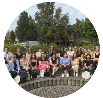
Journée d'intégration des étudiants à Sarreguemines