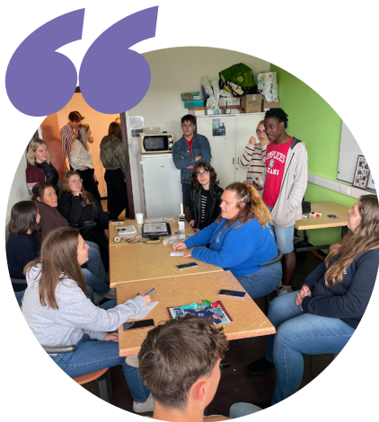
Journée d'intégration des étudiants à Épinal