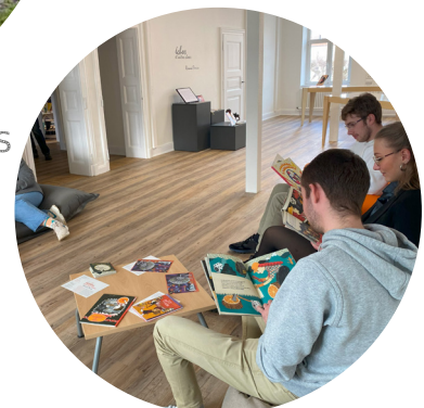
Un nouvel espace au sein de la B.U. de Montigny-lès-Metz : La Fabulathèque