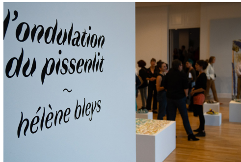
Galerie d'art Le Préau : vernissage de l'exposition d'Hélène Bleys (2024)