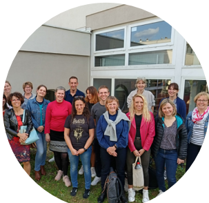
Bienvenue à la promotion 2024 du D.U. Allemand