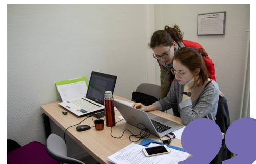
Nos étudiants travaillent en mode projet dans des espaces rénovés.