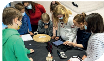
Élèves de CM2 de l'école Maurice et Katia Krafft de Houdemont, ravis de jouer les détectives !