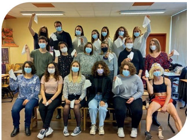
Les 25 étudiants du site d'Épinal ont donné de la voix !