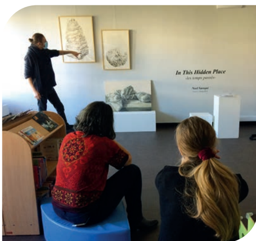
Noel Varoqui et des étudiantes de M1 échangent devant les œuvres originales de l'artiste présentées dans la BU du site d'Épinal.

Le peintre Noel Varoqui a présenté l'exposition In This Hidden Place au Préau, ainsi qu'une extension -les temps passés- déployée hors les murs dans les Bibliothèques Universitaires de l'INSPÉ de Lorraine, sur les sites de Bar-le-Duc, Épinal, Maxéville et Metz-Montigny. Noel Varoqui vit et travaille à Lahaymeix, l'un des six villages du Vent des forêts , célèbre centre d'art contemporain dont les œuvres sont installées au cœur des sentiers forestiers meusiens qu'il fréquente régulièrement, et dont il est également un des artistes reconnus. Au Préau, Noel Varoqui a présenté une série de grandes toiles peintes à l'huile évoquant justement ces forêts meusiennes, sources principales d'inspiration pour lui, qui travaille parfois directement au milieu des arbres. À la fois sombres, romantiques, mais convoquant aussi le merveilleux, les immenses et sublimes peintures immersives de Noel Varoqui ont plongé le spectateur dans une scénographie ambitieuse, une clairière spécialement imaginée pour la galerie par l'artiste, et qui a pu être réalisée grâce au précieux concours de l'ensemble de notre équipe technique du site de Maxéville.