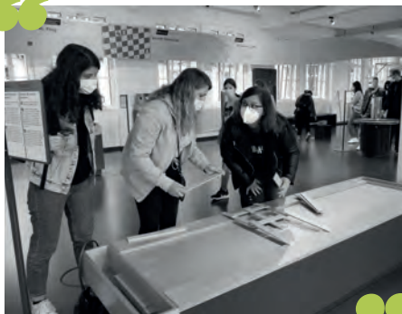
Le Dynamikum, toujours aussi accueillant.

Avec le retour au présentiel, tous les étudiants du site de Sarreguemines ont pu se rendre en Allemagne et ont découvert le centre Dynamikum, à Pirmasens, afin de redécouvrir le mouvement (rebond, tourbillon, sinuséide...). Dans un second temps, ils se sont librement promenés dans la rue piétonne de la petite ville. Cette sortie culturelle a permis aux étudiants de vivre des expériences en immersion linguistique.