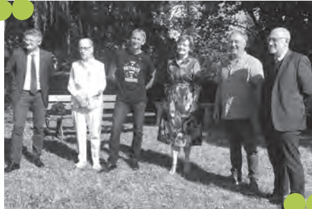
Souvenir de la cérémonie du 24 septembre, sous un beau soleil automnal dans le parc de notre site de Maxéville.