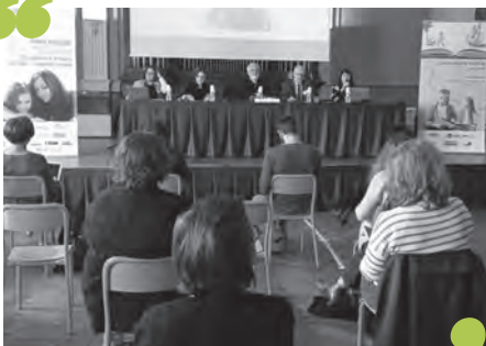
Les images de la journée organisée en présentiel ont pu être captées par le service communication en vue d’un projet de web-série.