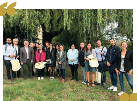
Journée d'accueil des nouveaux personnels le 16 septembre