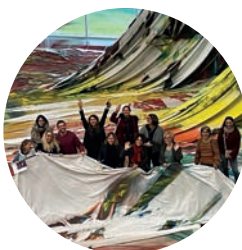
Visite Centre Pompidou-Metz