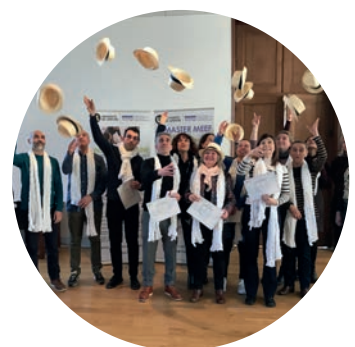
Remise de diplômes