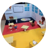
Projet « Ma classe d'allemand »