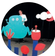
Spectacle « Blablabel »