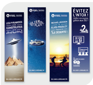
Des marque-pages pour sensibiliser à l'"infox" !

Comment les bibliothèques, et notamment les bibliothèques universitaires, peuvent-elles participer à la lutte contre les "fake news" (ou plutôt "infox", comme nous le recommande la Commission d'enrichissement de la langue française) ? Cette question a fait l'objet d'une récente journée d'études, organisée par l'ADBU (Association des directeurs et personnels de direction des bibliothèques universitaires et de la documentation). Cette même association lance le programme « Les bibliothèques universitaires pour une information fiable et de qualité » qui promet et encourage les initiatives et l'engagement des bibliothécaires dans ce défi.