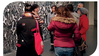
Les médiations ont été très appréciées des différents publics.