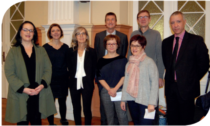
Le comité d'organisation

L'ESPÉ de Lorraine, site de Metz-Montigny a eu l'honneur d'accueillir dans ses murs les premières Journées interprofessionnelles "petite enfance", organisées par la Ville de Metz et l'Éducation nationale. Destinée