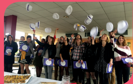
... Et le site de Bar-le-Duc fêtait ses diplômés du Master MEEF 1 er degré à la suite des portes ouvertes. Bravo à la promotion 2017/2018 !