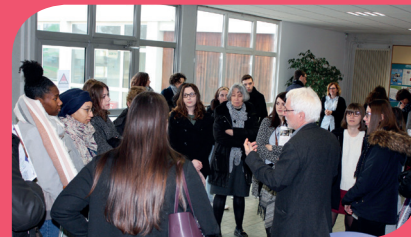
Une belle affluence sur le site d'Épinal ...

Bravo à toutes les équipes de l'ESPÉ de Lorraine pour l'organisation des journées Portes Ouvertes de nos 5 sites durant ce mois de mars ! Cette année encore, ces matinées de rencontres ont remporté un vif succès : ce sont en effet plus de 600 visiteurs qui ont rencontré enseignants, étudiants et personnels, visité les locaux, les salles de cours, les espaces de ressources (bibliothèques, informatique, Maison pour la Science, Le Préau, etc...) et partagé un moment de convivialité avant de repartir.