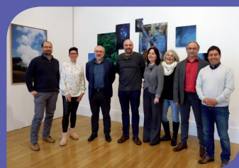
Une partie des candidats au CAFFA-AEFE

En janvier dernier, des collègues français enseignant à l'étranger (réseau AEFÉ : Agence pour l'Enseignement Français à l'Étranger) et candidat/e/s au CAFFA (Certificat d'Aptitude à la Fonction de Formateur Académique) sont venus en Lorraine pour la passation de l'épreuve d'admissibilité et la poursuite de leur formation. Arrivé/e/s du Caire, de Londres, de Prague ou d'ailleurs, ils ont été accueillis pour un temps de travail spécifique autour des compétences professionnelles du formateur. Atelier d'analyse de pratique professionnelle, séminaire de travail sur les problématiques retenues pour le mémoire, exploration de thématiques comme celle de la circulation des savoirs en formation... ont été l'occasion pour ces collègues très motivés de prendre du recul sur leur pratique professionnelle. En marge de la formation, ils ont partagé des temps de convivialité : visite de Nancy, médiation autour de l'exposition "Umwelt" au Préau... De l'avis de tous, cette première expérience de formation s'avère réussie. L'ESPÉ de Lorraine réfléchit maintenant à étendre la formation à d'autres zones géographiques de l'AEFE.