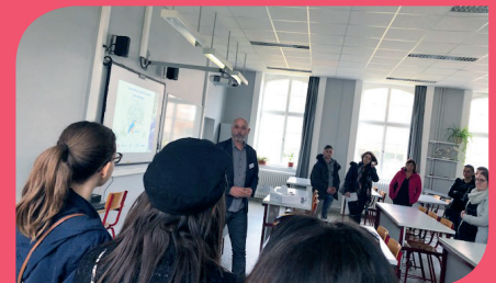
... et sur le site de Metz-Montigny