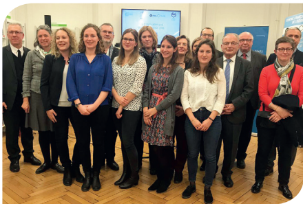
Le Prix franco-allemand de la chancellerie est le fruit d'un partenariat entre l'académie de Nancy-Metz, l'Université de Lorraine, le Goethe-Institut et l'Association des Amis de l'Université de Lorraine (AAUL).

Elle comprend le suivi de la formation des enseignantes, le retour et ressenti des élèves et, enfin, le film d'animation produit avec et par la classe.