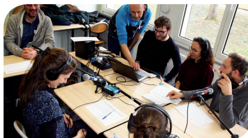
Ambiance conviviale lors de l'atelier "Web radio"